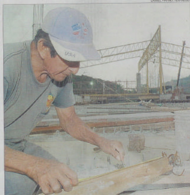
El octubre estará lista la nueva infraestructura del hipermercado.

Todas las investigaciones indican que tendemos a contratar y promover a personas como nosotros. Cuando decidimos contratar a alguien por una simple corazonada, estamos, de manera subconsciente, evaluándonos a nosotros mismos. Tenemos la corazonada de que existen afinidades entre nosotros y el candidato y luego usamos la lógica para racionalizar ese sentimiento.