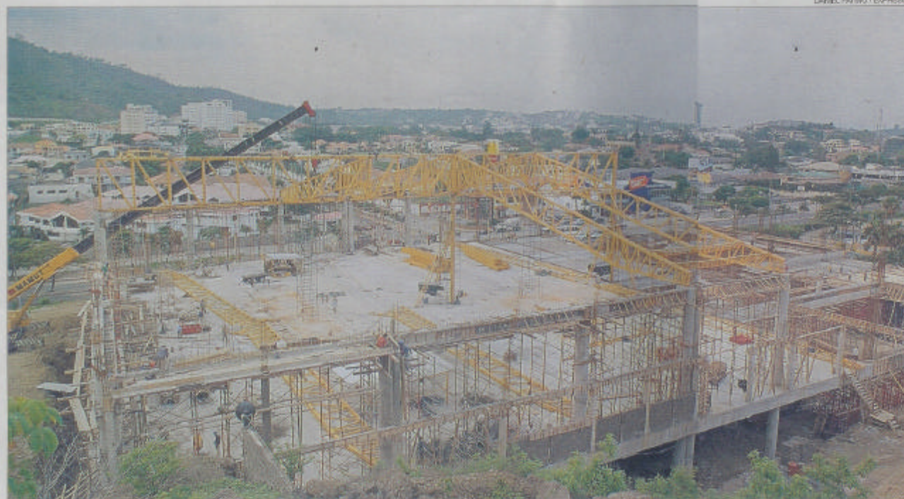
Un supermercado ubicado en los Ceibos, de 6.000 metros cuadrados, construye Supermercados La Favorita y estará terminado en octubre.

Aumentos de capital 641,9 Constituciones 28,6