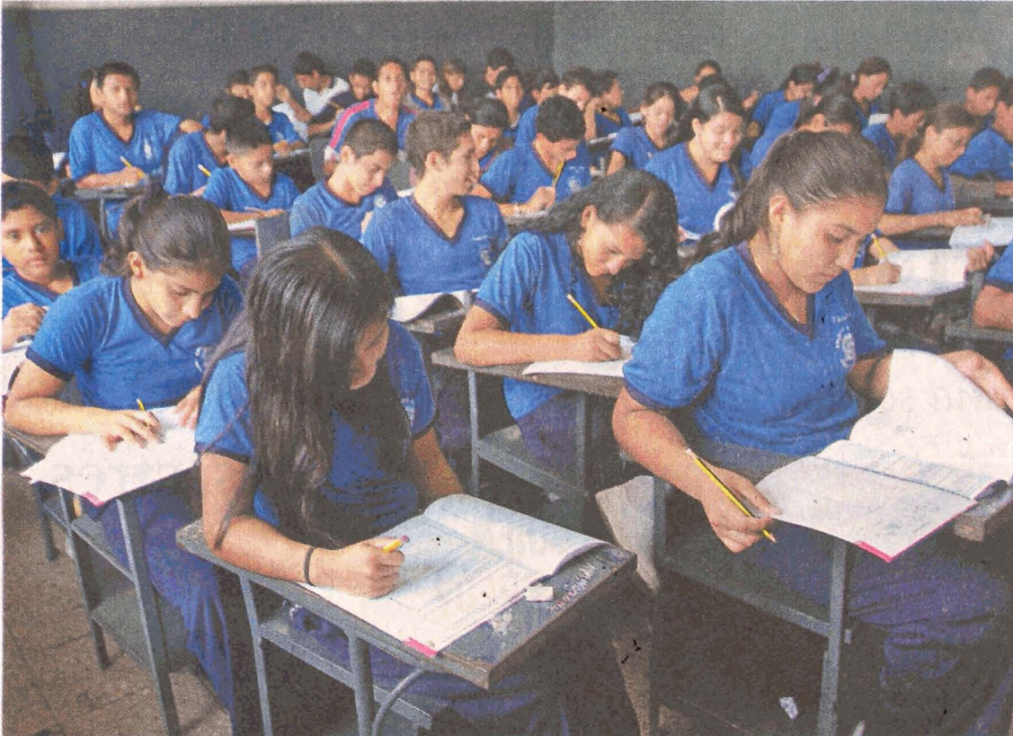
PRUEBAS. Alumnos de décimo año del colegio Camilo Destruge responden la prueba de Sociales.