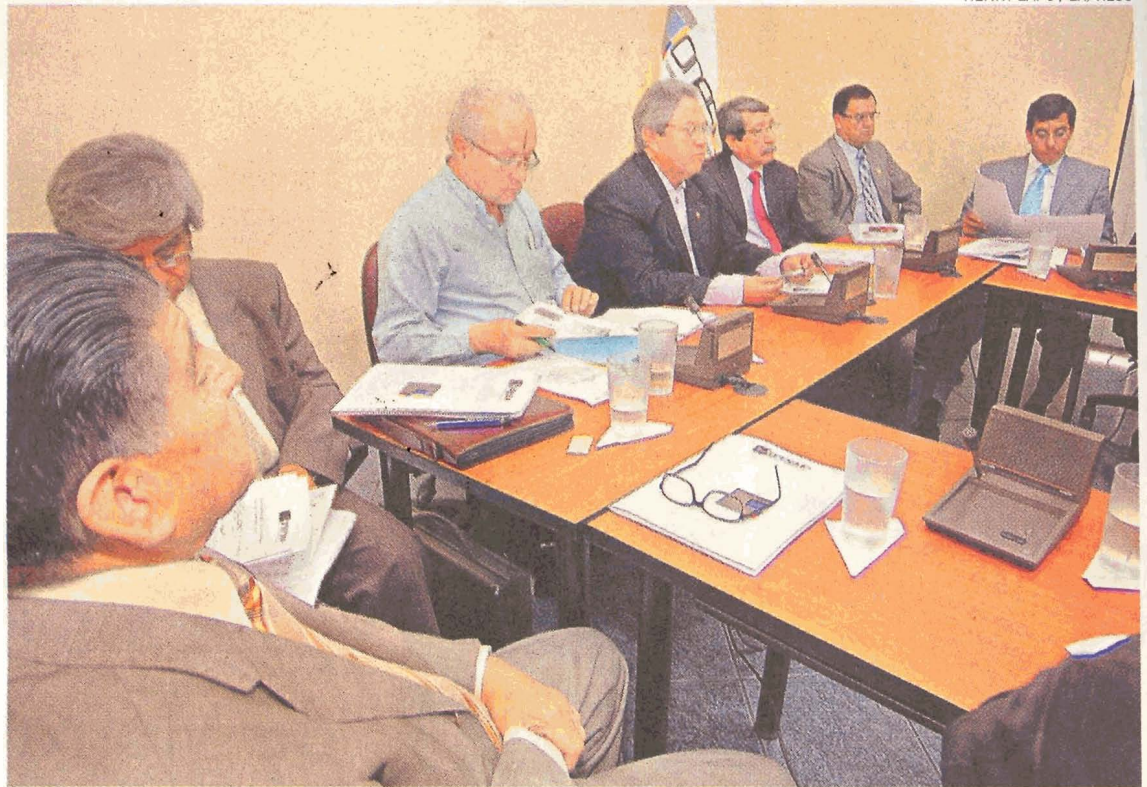
REUNIÓN. Los rectores de las 26 universidades públicas se reunieron el miércoles pasado en Quito.

Dentro del pedido de las universidades también se destaca el aplazamiento del ingreso de las entidades educativas de ni-