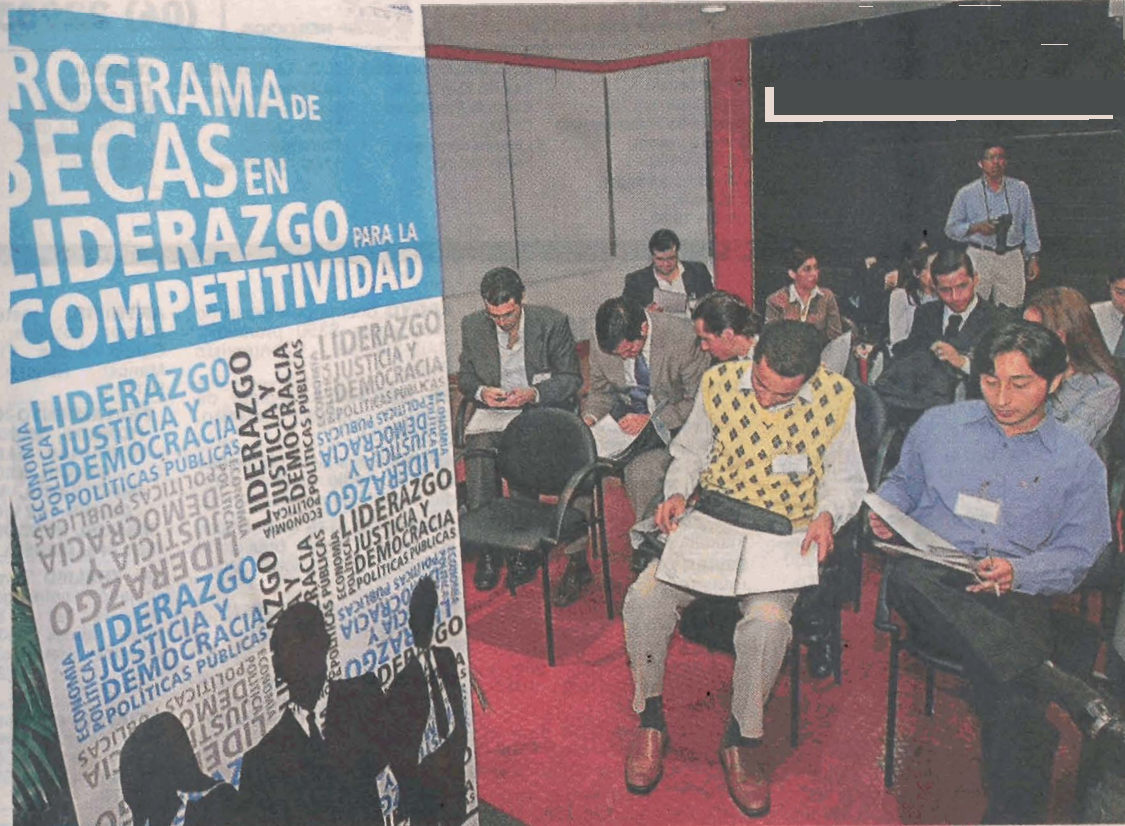
CLASES. El primer módulo del programa se inició la noche del jueves, tras el acto de inauguración.

sin preparación previa. En cambio hay jóvenes interesados en los problemas sociales o con cierta inclinación política que no tienen dónde formarse.