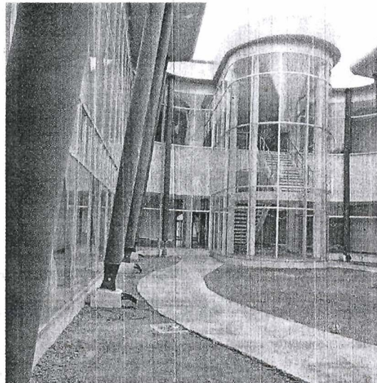
CTI. El Centro de Tecnologías de la Información está terminado, solo falta el mobiliario para iniciar el traslado y su inmediato funcionamiento en el Parque del Conocimiento.

"La finalidad del Parque del Conocimiento es impulsar el crecimiento sostenible y desarrollo económico para las empresas, ciudades, regiones y países", resaltó Calderón.