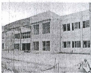
EDIFICIOS. En octubre estarían terminados los nuevos edificios donde funcionarán las unidades de Turismo y de Diseño y Comunicación.

La Espol Prosperina cuenta con una población de 10.000 estudiantes y está asentada en un terreno de 32.000 metros cuadrados.