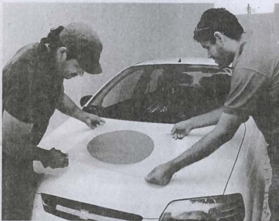
Actualmente se colocan los stickers que llevarán los autos de práctica, dentro del campus de La Prosperina de la Espol.

senométrica se pueden detectar problemas de visión o audición, por lo que los interesados son derivados a cualquier médico especialista para que les recete el uso de anteojos o de prótesis auditiva, con lo que podrán volver a presentarse.