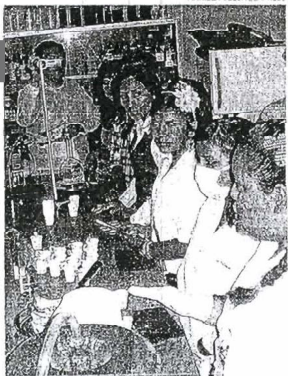
PROYECTOS. El Colegio Técnico El Triunfo logra desarrollar iniciativas de microempresas con el apoyo de la Prefectura del Guayas.