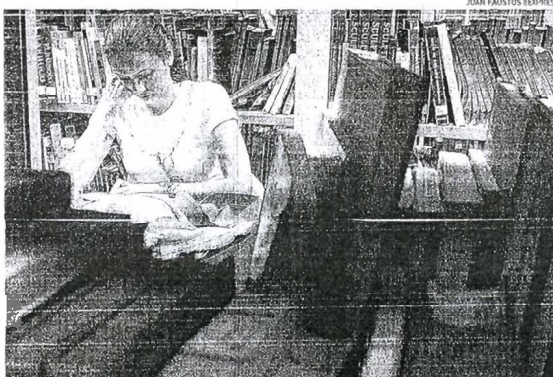
ESTUDIOS. Aunque el nivel dominante de educación es la primaria, muchas personas siguen estudiando hasta llegar a niveles superiores.

El Espol tomó esos datos para definir los estándares de educación de la población ecuatoriana en general, y de la provincia de Guayas y sus cantones en particular, tomando en cuenta varias categorías: nivel preescolar, educación básica, superior, analfabetismo primario, secundaria, bachillerato, posgrado, postbachillerato y centros de alfabetización. El trabajo resalta que mientras más cerca esté un cantón de Guayaquil, el nivel educativo es mayor. Prueba de ello es Samborombón donde hay un menor nivel de analfabetismo y mayor número de personas que han cursado posgrados (4,8%), incluso más que en Guayaquil (1,1%).