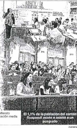
El 1,1% de la población del cantón Guayaquil asiste o asistió a un posgrado.