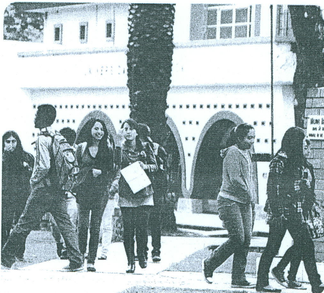
Los alumnos de las universidades, categoría E, son evaluados previo a reubicarlos en otros centros de estudios para que así continúen sus carreras.

‘La tragedia de la educación en el Ecuador ha sido por la calidad de los docentes’: Moisés Tacle