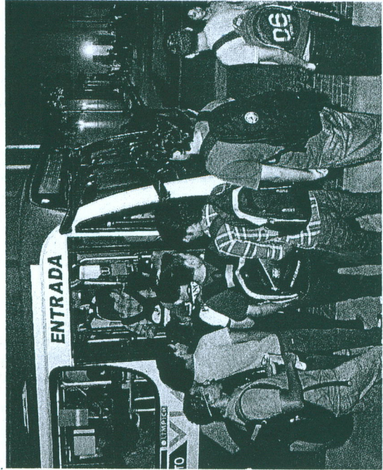
Estudiantes de la Espol con opción de transporte.