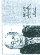
SERGIO FLORES, rector de la Espol

Sobre esa base, estos presentaban los resultados y las instituciones podían aceptarlos