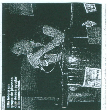
Ella lidera un grupo de jóvenes que desea ayudar a la comunidad.