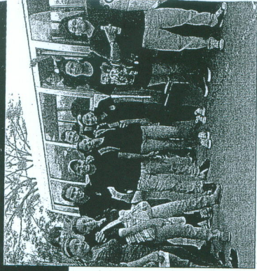
Grupo de amigos universitarios, unidos para ayudar.