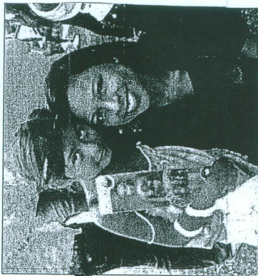
Regalando juguetes a los niños.