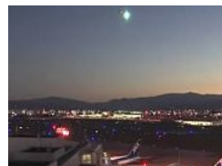
Captan paso de una bola de fuego en el cielo de Japón