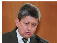
Código Laboral agrega otras cinco causas para visto bueno