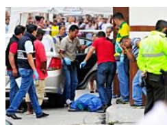
Asesinó a su expareja en un auto frente a sus dos hijos