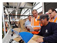
Salvaguardias globales irán al FMI y la OMC, dice González