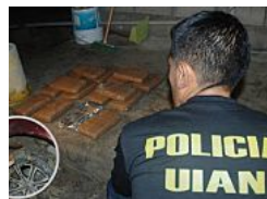
En cantón Playas 'licuaban' coca con harina de pescado