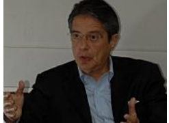
Lasso: Si Rafael Correa quiere que me reúna con Maduro o Castro, no...