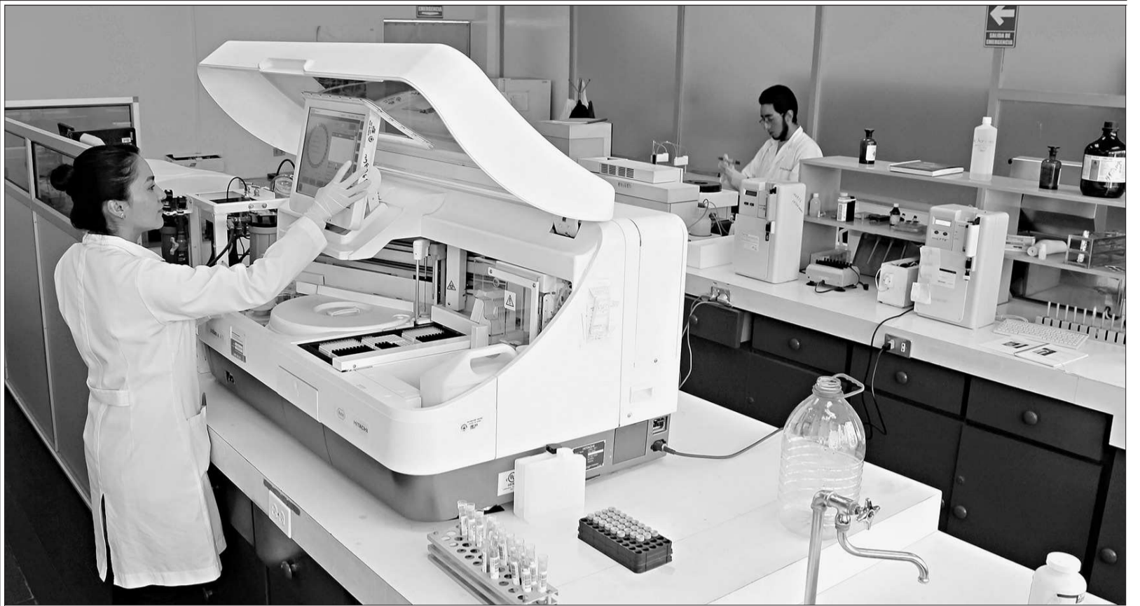
• El laboratorio clínico bacteriológico de la Facultad de Ciencias Químicas de la Universidad Central es una de las fuentes de recursos propios.

INFORME Los posgrados, cursos de educación continua y más proyectos son las fuentes con las cuales los centros generan sus propios recursos