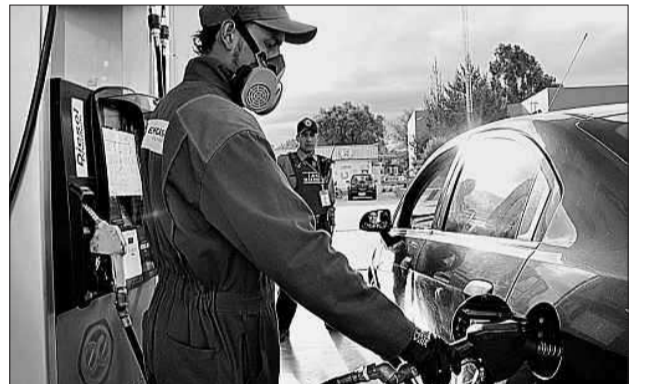
• La Gasolinera Politécnica es una de las fuentes de financiamiento propio de la Espoch, en Chimborazo.