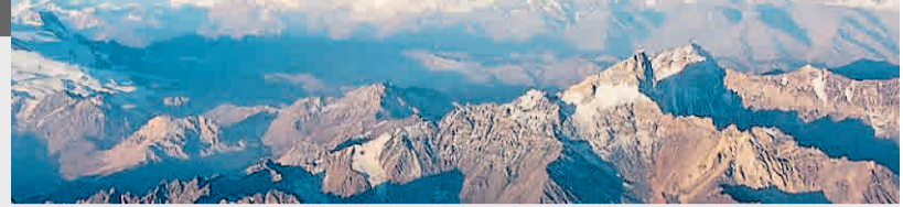
Cordillera de los Andes.

sobre el agua y una cadena montañosa en la tierra (los Andes). Si chocan dos placas oceánicas se forman islas (Japón). Si chocan dos placas tectónicas terrestres el resultado son cadenas montañosas (Himalayas).