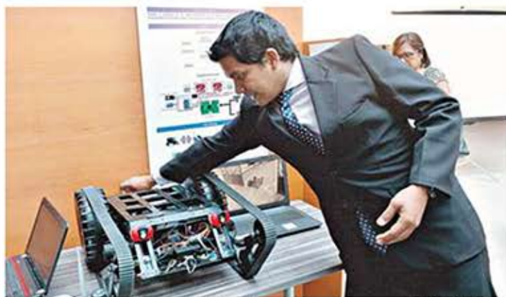
El robot explorador creado por politécnicos de Ingeniería en Telemática ayuda a visualizar lo que ocurre al interior de estructuras colapsadas.