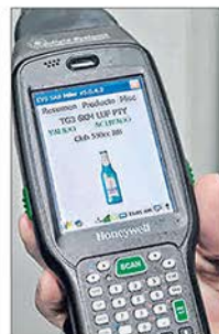
Dispositivo. El escáner rastrea la información de las bebidas.

EL INFORME DE ESPAE en nuestra app GRANASA. Búscanos en App Store y Google Play.