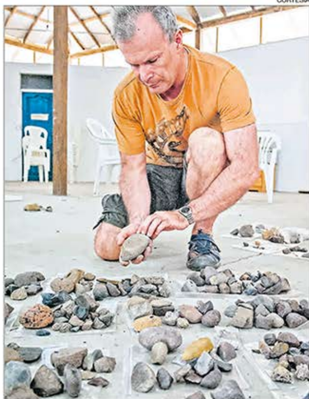
Excavación. La Espol trabaja actualmente en el yacimiento de Real Alto.

Adicionalmente, el artículo 98 de la Ley Orgánica de Cultura, que entró en vigencia el año pa-