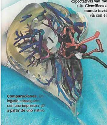
Comparaciones. Un hígado conseguido con una impresora 3D a partir de un nativo.