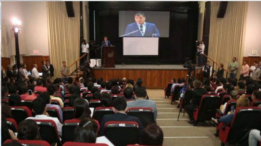
Rafael Correa dictó la cátedra 'Macroeconomía, transformación y desarrollo en Ecuador' en la Espol.

Redacción Guayaquil · 13 de julio de 2016 08:28