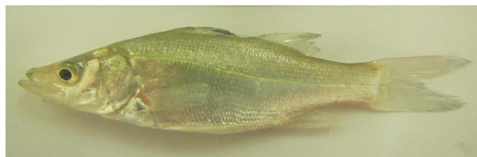
Juvenil de robalo

En general las especies de la familia Centropomidae son considerados peces eurihalinos, sin embargo, en robalo prieto no se conocen los rangos óptimos en los que esta especie presenta su mejor desempeño en términos de crecimiento y supervivencia.