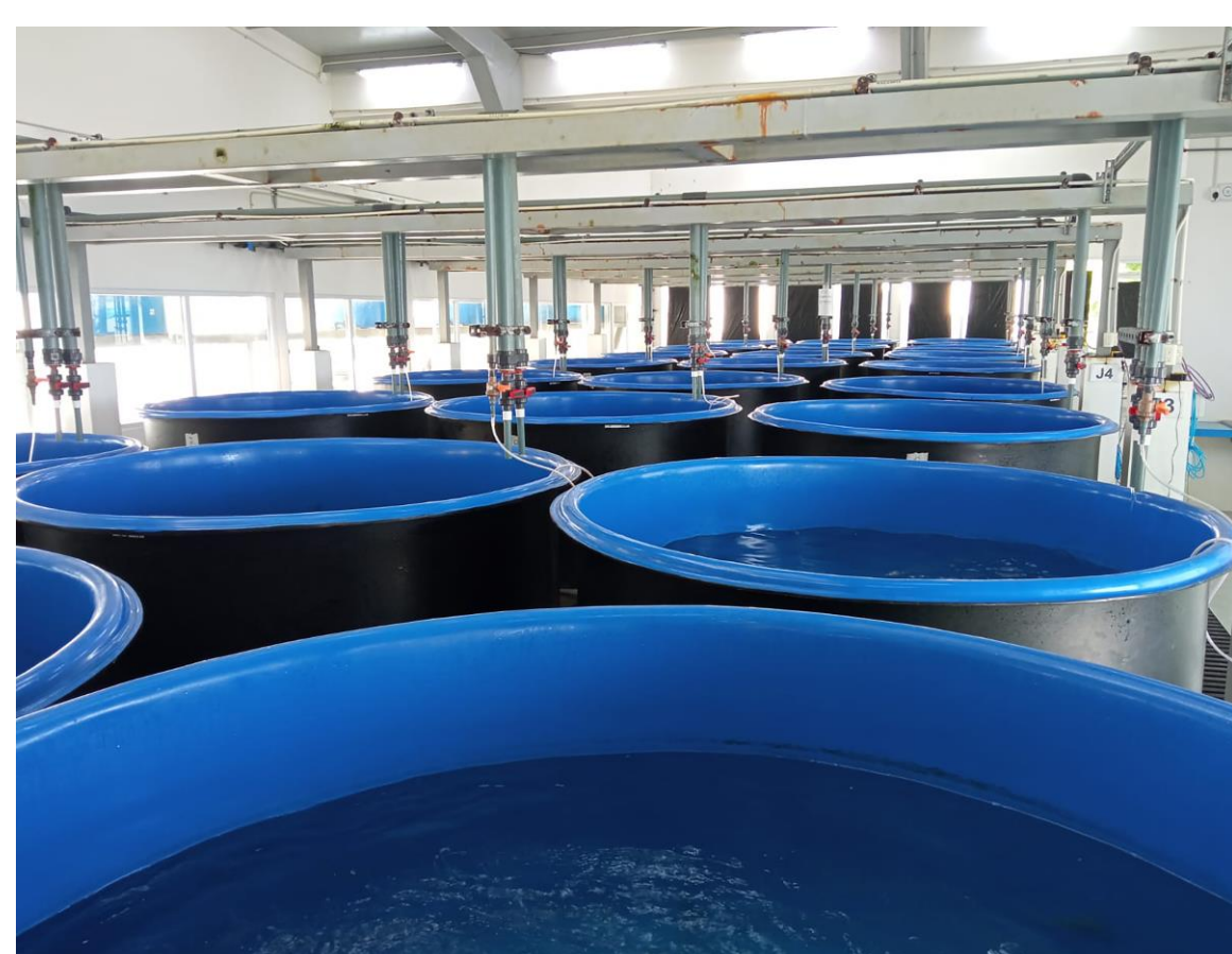
Baterías de tanques con sistema de recirculación

Evaluar los efectos de la salinidad del agua en la supervivencia, crecimiento y condición morfológica de robalo prieto.